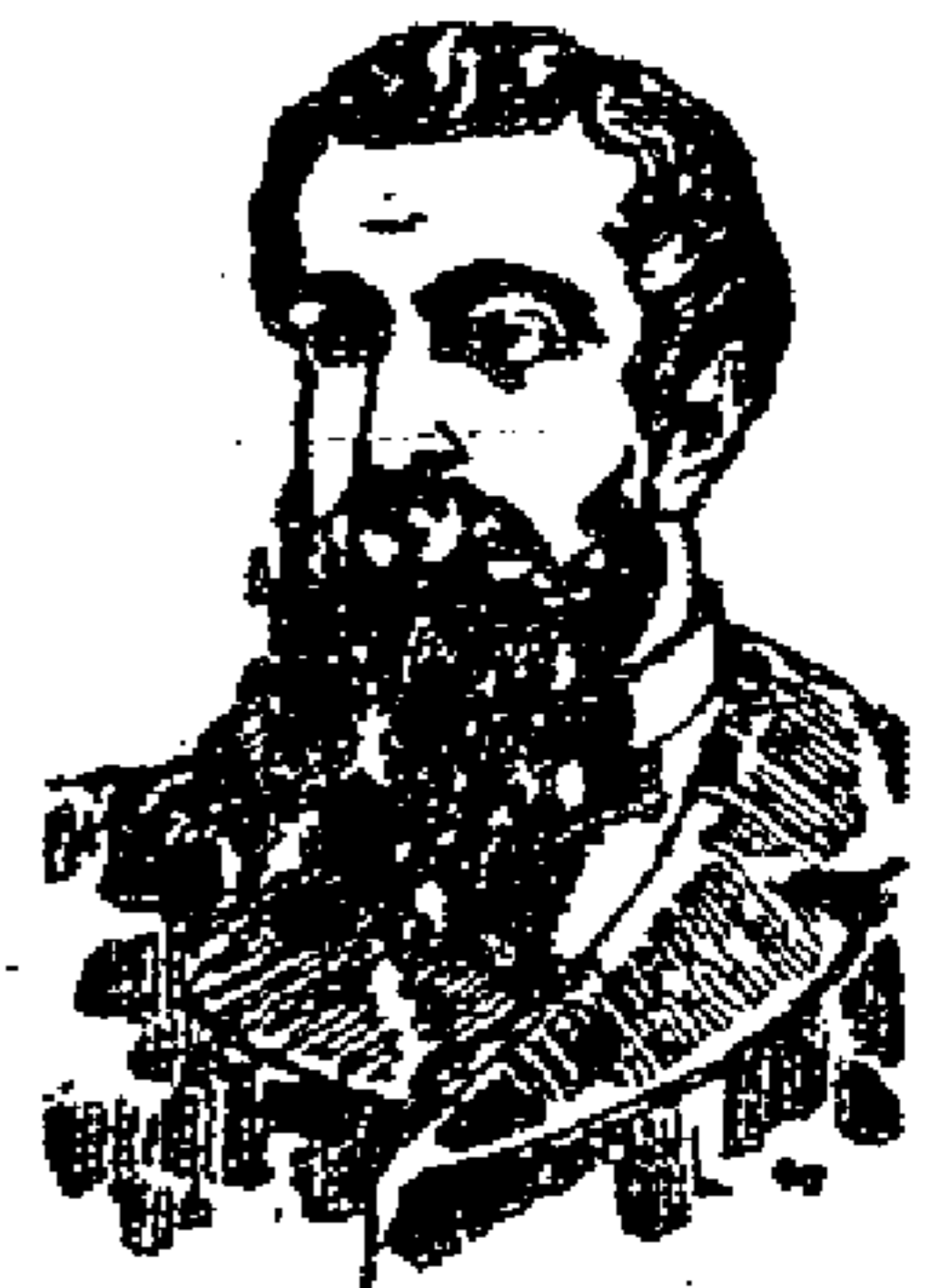
DEPO. LA CURA